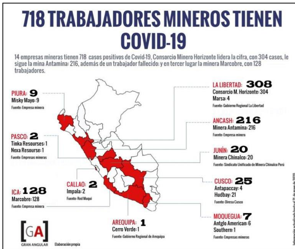
Figura 2: Número de trabajadores mineros infectados con Covid-19 en Perú, por compañía y región

Otro factor debido a la pandemia y la consiguiente contracción de los mercados de materias primas que ha afectado a los trabajadores del sector minero peruano fue la disminución del empleo en el sector. A medida que las explotaciones mineras reducían sus operaciones o cerraban por completo, fueron buscando formas de reducir los costos de la mano de obra. Para ello, las empresas mineras peruanas siguieron básicamente cuatro estrategias diferentes, legales y extralegales (nos basamos en FENTECAMP, 2020 y otras fuentes):