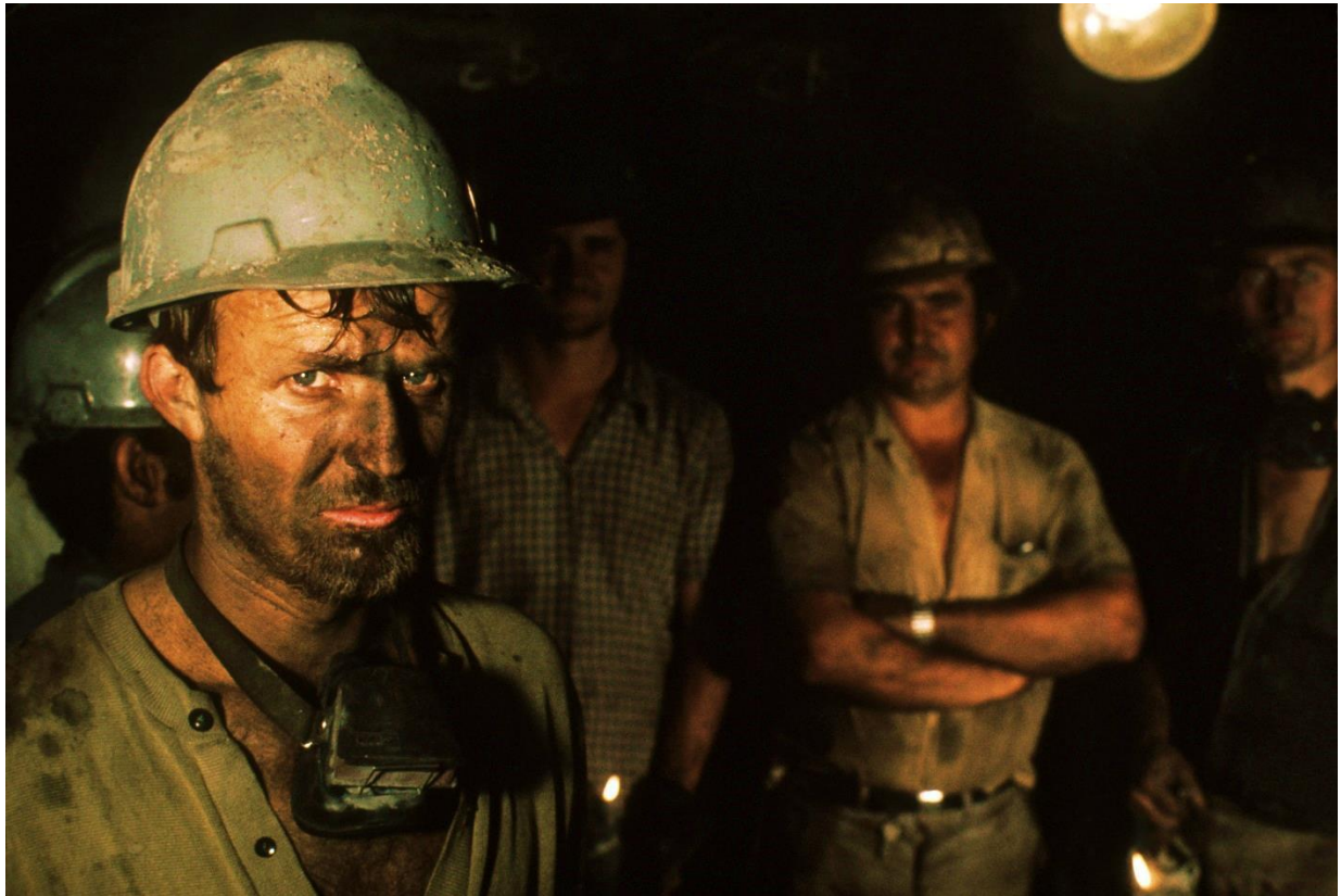
"Mineros en Brasil"