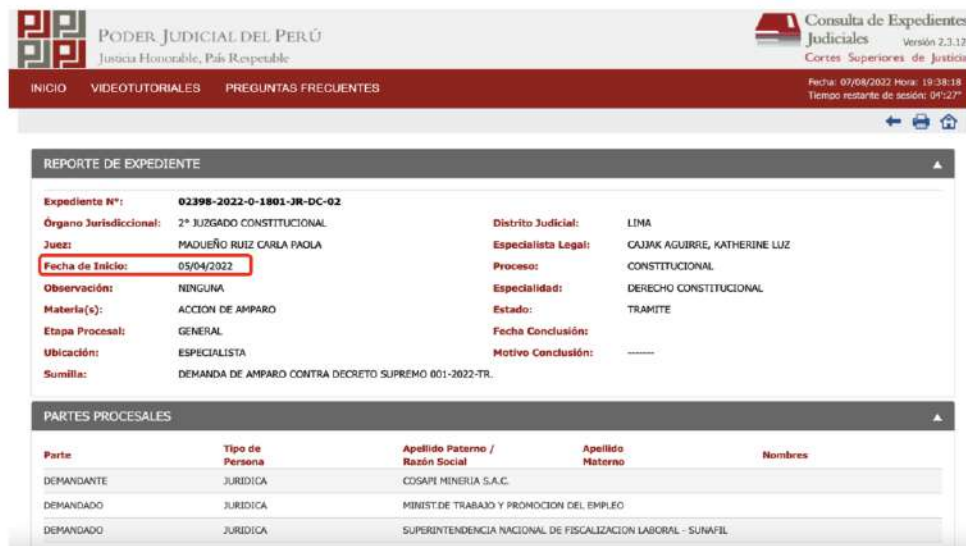
Imagen de la consulta de expedientes del Poder Judicial respecto el Expediente N° 02398-2022-0-1801-JR-DC-02: