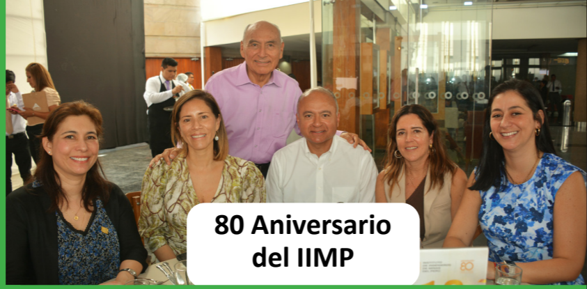
80 Aniversario del IIMP