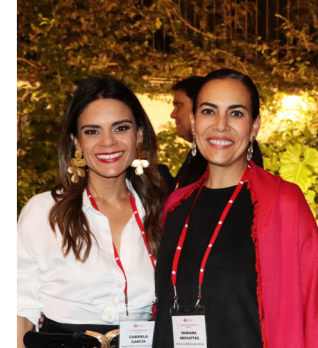
Cámara de Comercio Canadá - Perú