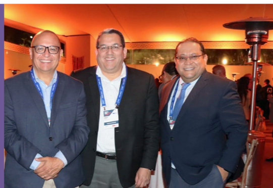
Aloxi - CADE 2023